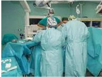
Sala operatoria (foto di repertorio)

Secondo il sindacato di base gli operatori sono scesi da 8 a 4. “A risentire di questa carenza sono le sale operatorie, che riducono gli interventi”