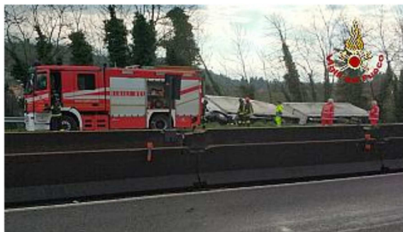
Vigili del fuoco di Figline in azione sull'A1

Un autotreno si è ribaltato questa mattina in autostrada. Gli uomini del distaccamento di Figline Valdarno hanno estratto il conducente del mezzo