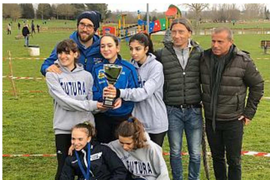
Le ragazze dell'Atletica Futura