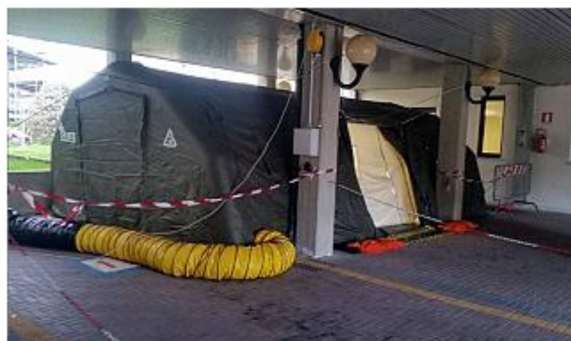
La tenda al Serristori che doveva ospitare gli operatori

Gli operatori del servizio pre-triage per il momento non saranno in servizio al Serristori. “Perché siamo considerati cittadini di serie B?”