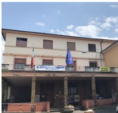
Il municipio di Figline Incisa

Il Comune rende note la nuova organizzazione degli uffici e le attività permesse per garantire la prevenzione e la sicurezza dei cittadini