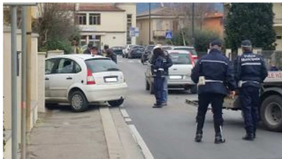
Incidente stradale in via Torquato Toti a Matassino

Per circa un'ora via Torquato Toti, nella frazione di Matassino, è rimasta chiusa al traffico nel tratto finale. Cause in corso di accertamento