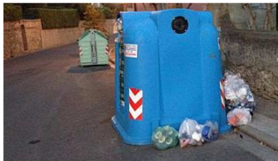
Rifiuti abbandonati (foto di repertorio)

La vicenda innescata da una documentazione video-fotografica in mano ai Vigili urbani. Ordinanza di ingiunzione per la violazione del regolamento