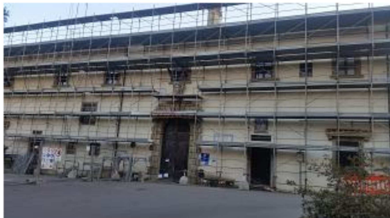
Villa San Cerbone con l'antico ingresso all'ospedale

Il giorno 8 marzo la zona antistante la facciata con l'antico ingresso all'Ospedale Serristori resterà chiusa fino alle 19 per il montaggio della gru